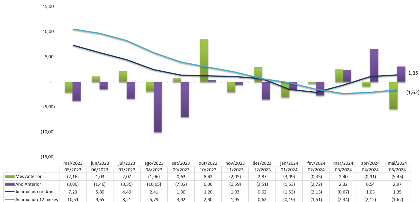
Gráfico 1 - Evolução histórica das variações em relação ao mês anterior, mesmo mês do ano anterior, acumulado do ano e acumulado de 12 meses – maio de 2023 a maio de 2024

O comércio em geral encerrou maio de 2024 com queda em relação a abril de 2024, de -5,45%, acompanhando a queda de -0,91% do mês de anterior. Se comparado a igual período de 2023, houve uma elevação de 2,97%. Na variação do acumulado do ano está em elevação de 1,35% e, no acumulado de 12 meses, queda de -1,62%.